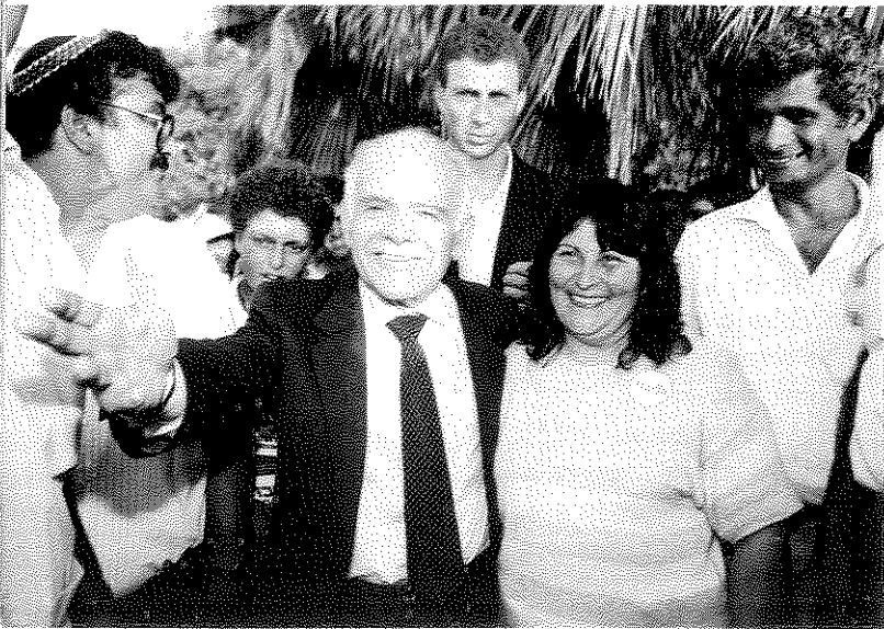
במאבק על כל קול - יצחק שמיר במושב אחיסמן ליד רמלה

העברת בוחר מא' לב', ממפלגה אחת למפלגה אחרת, סבורני שההשפעה הזאת זניחה לחלוטין.